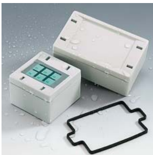
Gris clair, RAL 7035